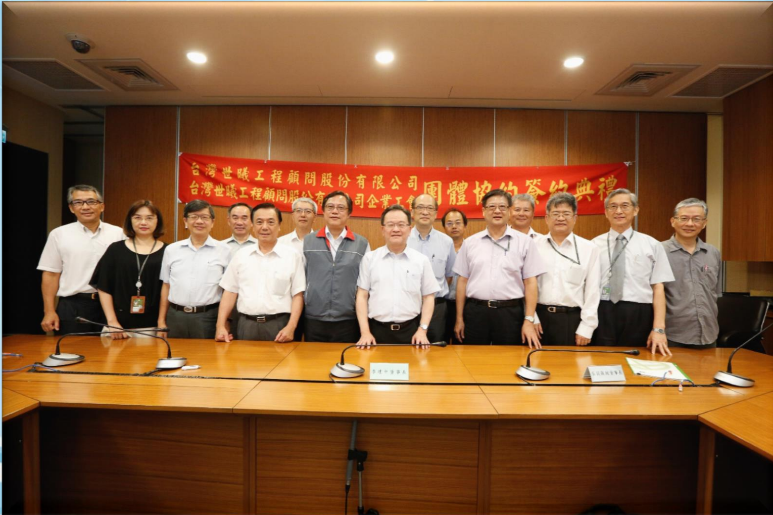
簽約後世曦公司副總經理以上主管及工會代表合影紀念