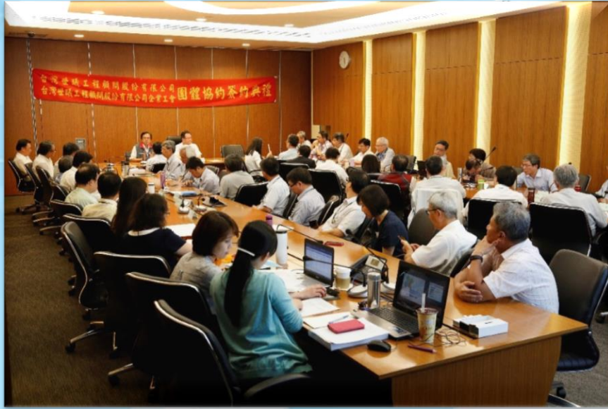
團體協約簽約典禮由世曦公司協理以上主管 及工會代表列席觀禮場面隆重盛大