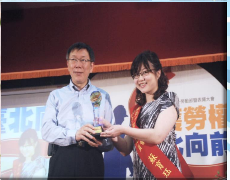
獲台北市政府頒105年優良工會；理事長獲頒優良勞工；秘書獲頒優良會務人員